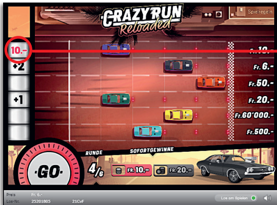
Verdoppelung (Zeile 2: Start und Ziel)