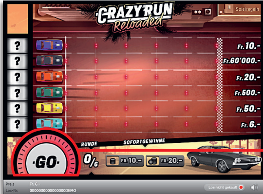
Sofortgewinn Fr. 10.- (Zeile 1 und «Sofortgewinne»)