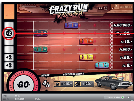
Beispiel: Gewinn Fr. 16.-